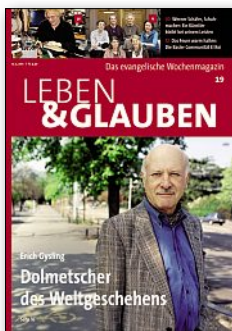
«Leben & Glauben» erscheint wöchentlich 51'000 Leser (MACH Basic 2011-2)