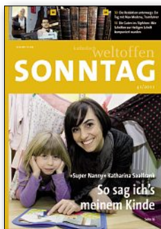
«Sonntag» erscheint wöchentlich 100'000 Leser (MACH Basic 2011-2)

Mit dem 50up trio erhöhen Sie ihre Reichweite im selben Markt. Ergänzt wird das 50up duo durch die Zeitschrift «Mein Magazin», welche durch ein einzigartiges Konzept besticht: Sämtliche Inhalte sind von den Leserinnen und Lesern selber geschrieben und durch eine professionelle Redaktion aufbereitet. User Generated Content at its best! Aber genau so, wie's die Zielgruppe der Best Ager bevorzugt: als herkömmliches Printmedium .